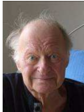
Heinz Vierling Wohnbereich Sonnenblumenweg