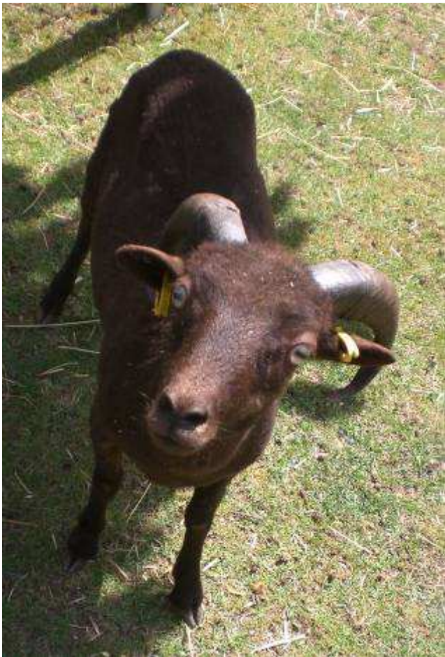
Unser Schafbock „Olek“ mit seiner neuen Frisur